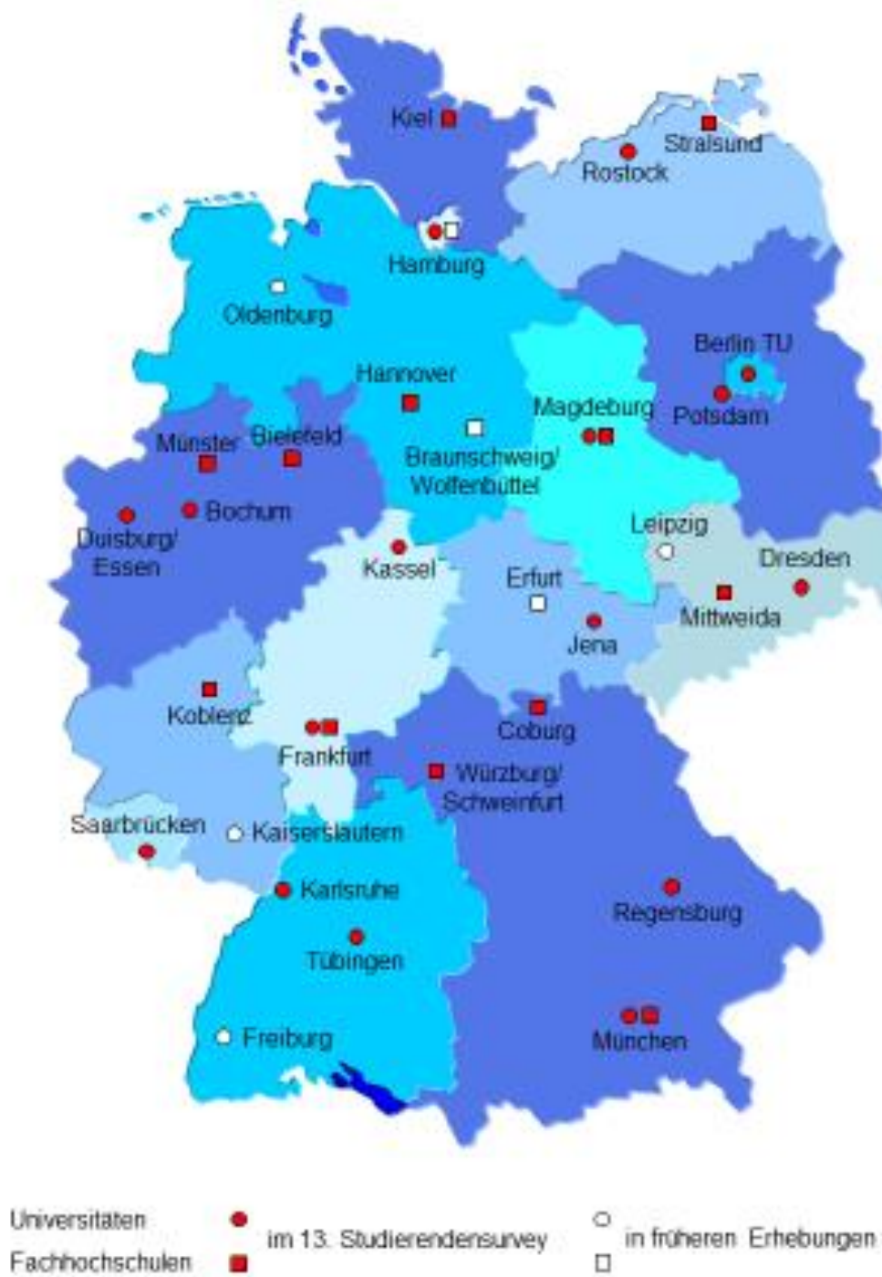
Samplehochschulen im Studierendensurvey 1982-2015

Quelle: Studierendensurvey 1982-2016, AG Hochschulforschung, Universität Konstanz