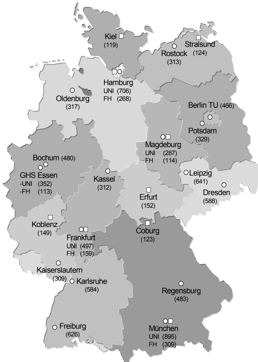
Karte 1 Standorte und Besetzungszahlen (befragte Studierende) der beteiligten Universitäten und Fachhochschulen des 9. Studierendensurveys im Wintersemester 2003/04